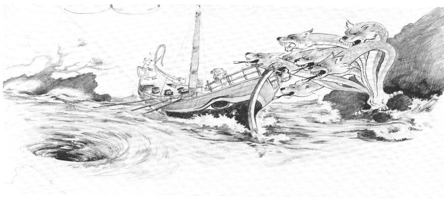
Illustration fra Varela og Maturana: Kundskabens træ, ASK 1987 s.133

informerer os, fordi der ikke er nogen mekanisme, som muliggør "information". På den anden side er der en anden fælde: ikke-objektivitetens kaos og vilkårlighed, hvor alt synes muligt. Vi må lære at gå midt imellem, lige på knivens æg."